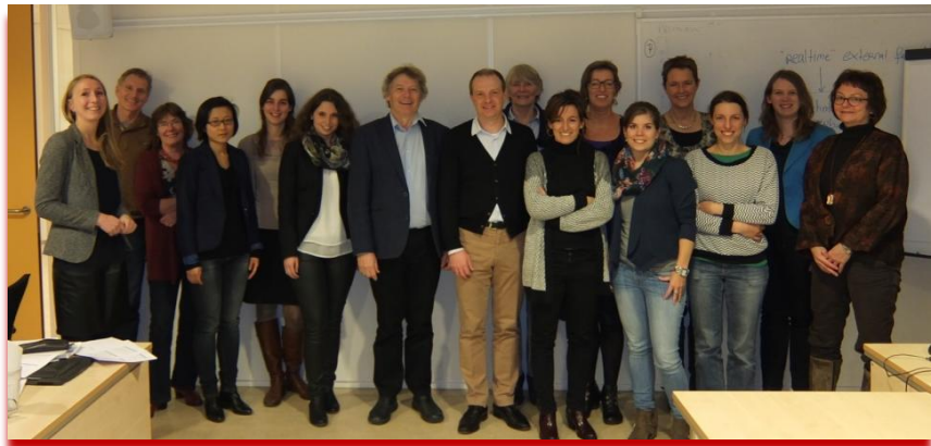
Op 20 januari 2015 werd de eerste SIG multimorbiditeit-bijeenkomst gehouden in het gebouw van het NIVEL, Utrecht.

bijvoorbeeld bijeenkomsten gehouden rondom de thema's mantelzorg, kwetsbaarheid en evaluatie van integrale eerstelijns zorgmodellen . In een recent opgerichte SIG staat co- en multimorbiditeit centraal. De achtergronden van de deelnemers aan deze groepen zijn divers, waardoor het thema vanuit verschillende perspectieven belicht kan worden. Er zijn mensen met een achtergrond in het onderzoek, maar ook mensen die ervaring hebben met de patiëntenzorg of die zich bezig houden met belangenbehartiging van patiënten. Tijdens de bijeenkomsten worden kennis en ervaringen met betrekking tot het thema besproken. Daarnaast wordt er aandacht besteed aan de rol die TOPICS-MDS kan spelen in het beantwoorden van de verschillende onderzoeksvragen die er zijn met betrekking tot de thema's. Op deze manier kunnen ook ideeën gedeeld worden over het gezamenlijk schrijven van onderzoeksvorstellen of artikelen. De verschillende groepen zullen meerdere keren samen komen. De eerste ervaringen zijn zeer positief! Wilt u graag meer informatie over bijvoorbeeld deelname aan een SIG of heeft u nieuwe ideeën om een SIG op te richten? Neem contact met ons op!